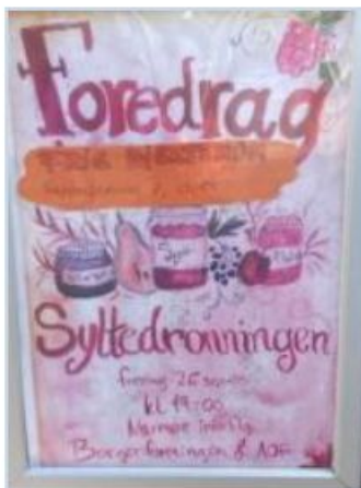
Foredrag med Syltedronningen hos Frie Hjerterum, Hammesbrovej 7,