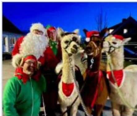
Juletræstænding Foran Købmanden